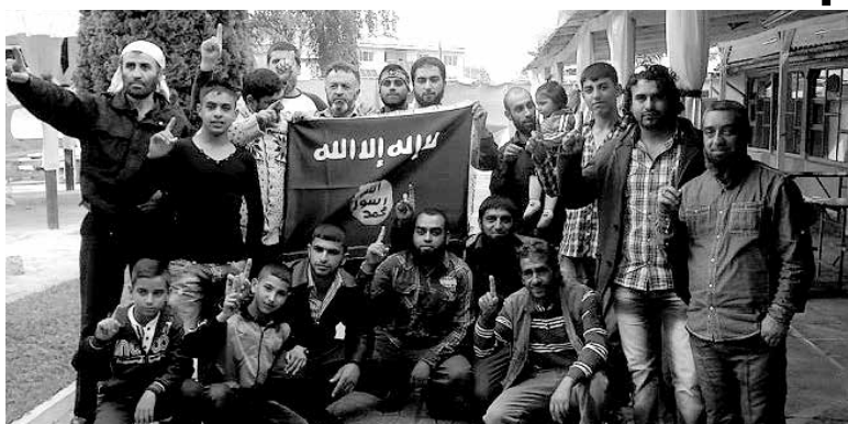
Знамето на „Ислямска държава“ бе развято в циганската махала в Пазарджик

Със 106 гласа „за“ народните представители приеха на първо четене промяната в Наказателния кодекс, която криминализира разпространението и проповядването на радикален ислям в България. Против бяха трима, въздържаха се десет.