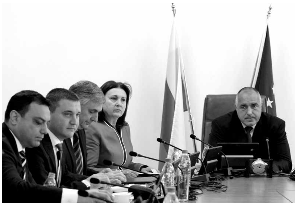
Румяна Бъчварова и Бойко Борисов по време на заседание на Министерски съвет

Мерките, които предлага ВМРО, вижте на стр. 7