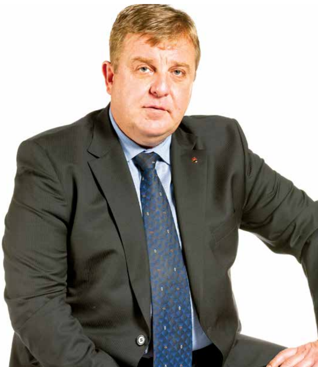
Красимир Каракачанов, председател на ВМРО - Българско национално движение

Повече по темата – четете на вътрешните страници на „България“