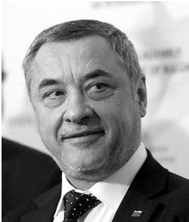
Валери Симеонов, съпредседател на Патриотичния фронт

Противоречие между патриоти и всички останали бележи работата на Столичния общински съвет. Поводът е имигрантската криза в Европа и нейното отражение върху сигурността в столицата.