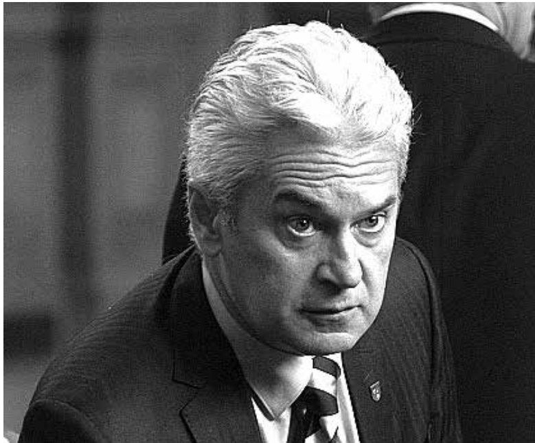
Волен Сидеров, председател на III „Атака“

Лидерът на „Атака“ Волен Сидеров наскоро се срещна с председателя на Националния фронт за спасение на България Валери Симеонов в рамките на инициативата на Красимир Каракачанов за общо явяване на патриотичните сили в изборите за президент. Влезли сме в политиката с идеи, а не да оправяме лични вражди, припомни по този повод Сидеров.