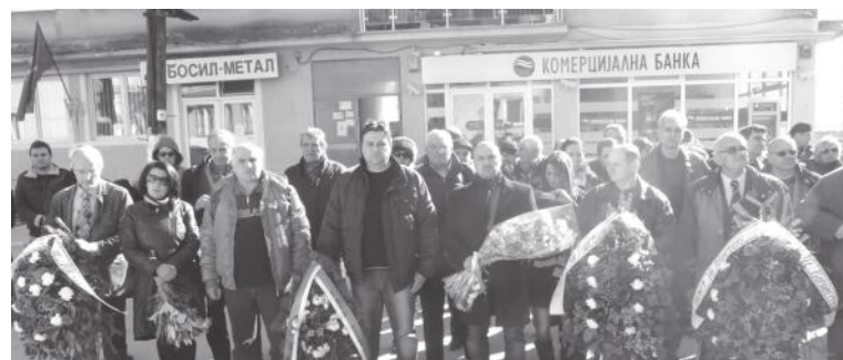
Депутатът от ВМРО с българи от Западните покрайнини отдават почит към Апостола на свободата Васил Левски

На зимната сесия на ПАСЕ скандалната намеса на управляващата в Република Сърбия партия в дейността на българското малцинство при изборите за Национален съвет стана достояние на представителите на всички европейски държави. Очаква се Комитетът на министрите да извърши проверка и да излезе с изрично становище по случая.