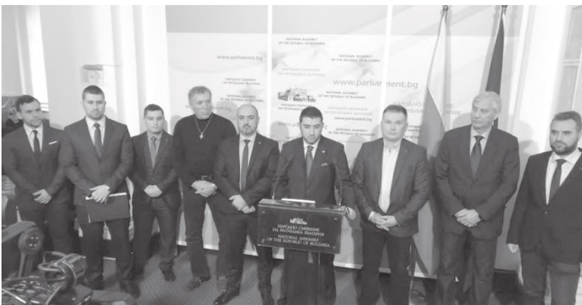
Предложението бе представено пред журналисти в парламента

Общинските съветници от ВМРО в Столичния общински съвет внасят доклад, който предвижда отпускане на еднократна финансова помощ за насърчаване на раждаемостта и отглеждането на деца на територията на Столичната община. Предложението на Патриотите е за първо дете помощта за семейството да е 200 лв., за второ – 500 лв., за трето – 1 300 лв., като условието е родителите да имат завършено средно образование. За по-висока степен на образование еднократната помощ е съответно по-го-