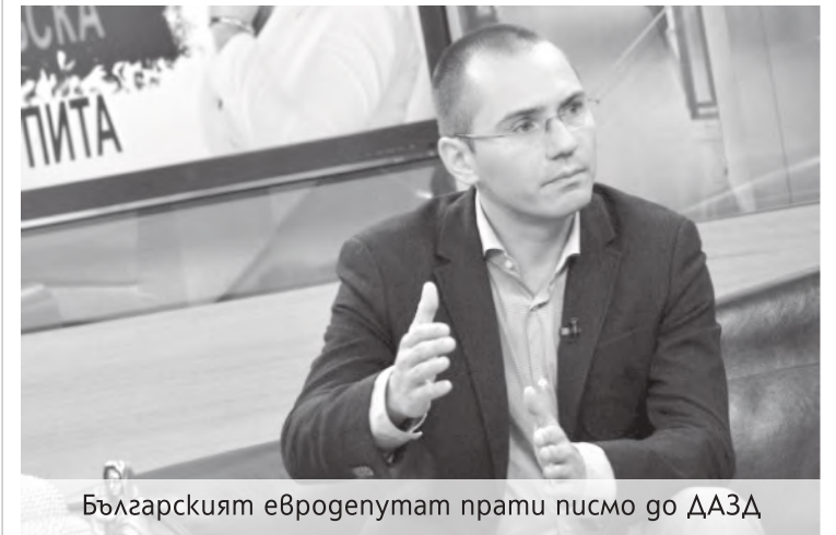
Българският евродепутат прати писмо до ДАЗД

Основната част на становището на Джамбазки вижте на страница 9