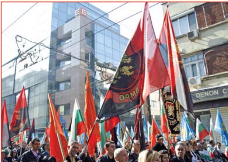
Над 6 000 души се включиха в акцията на ВМРО и ББЦ