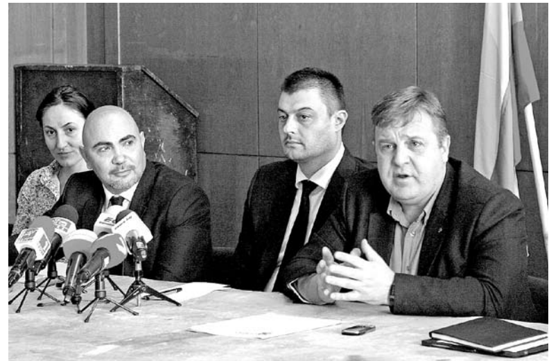
Красимир Каракачанов, Николай Барекков и Росен Петров по време на обща пресконференция на ВМРО и „България без цензура“

Партията подкрепя идеята референдуми да се произвеждат заедно с всички избори. Отказът