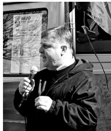
Председателят на ВМРО Красимир Каракачанов пред Министерството на правосъдието

МАНТАЛИТЕТ НА БЕЗРОДНИЦИ ИСКАТ ОТ ЕТНИЧЕСКИ БЪЛГАРИ ДА ПРЕДОСТАВЯТ ДОКУМЕНТ ЗА ПРОИЗХОД ВСЕ ЕДНО Е КАСОВА БЕЛЕЖКА.