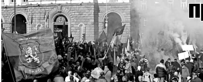
Хиляди се събраха в Триъгълника на властта – Министерски съвет, Народното събрание и Президентството

К огато протестиращите стигнаха до Министерски съвет, заместник-председателят на ВМРО Ангел Джамбазки заяви: „Пред нас е основният монопол – този на властта на прехода, който създаде монополите, срещу които протестираме!”