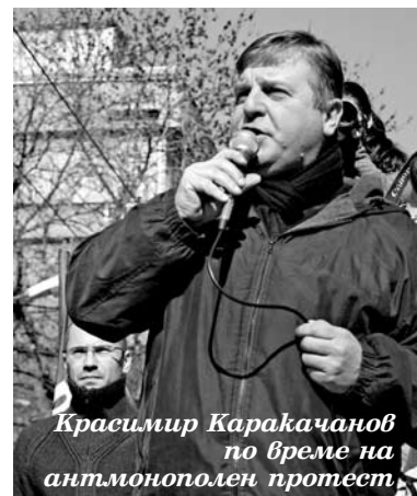
Красимир Каракачанов по време на антимонополен протест.

Заместник-председателят на ВМРО заяви още, че едно от тези дружества издържа чешкия пенсионен фонд. Според Джамбазки така едно национално предателство, каквото е даването на ЕРП-тата в чужди ръце, е довело и до