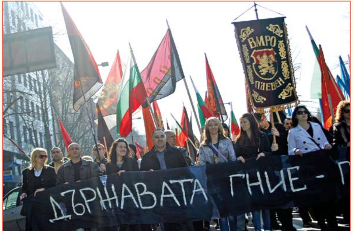
„ОСТАВКА“ огласи блокираната централна част на София