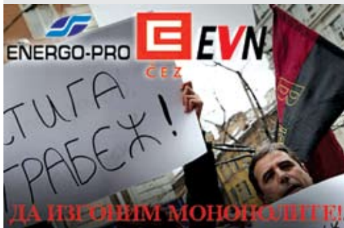
„България без цензура“ и ВМРО поведеха 6 хиляди души в нов протест срещу монополите Повече снимки вижте на стр. 8

ОБЕДИНЕНИТЕ СИЛИ НА ВМРО, „БЪЛГАРИЯ БЕЗ ЦЕНЗУРА“ И ЗНС ЗАСТАНАХА СРЕЩУ МОНОПОЛИТЕ НА ВЛАСТТА, СРЕЩУ ПРЕСТЪПНОСТТА И БЕДНОСТТА