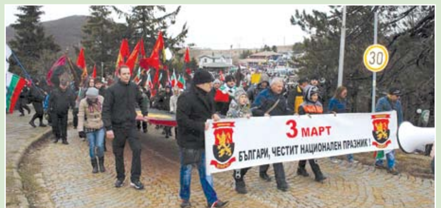
136-тата годишнина от освобождението на България от турско робство бе отбелязана от стотици членове на ВМРО от цялата страна пред паметника на връх Шипка, символ на историческата победа.