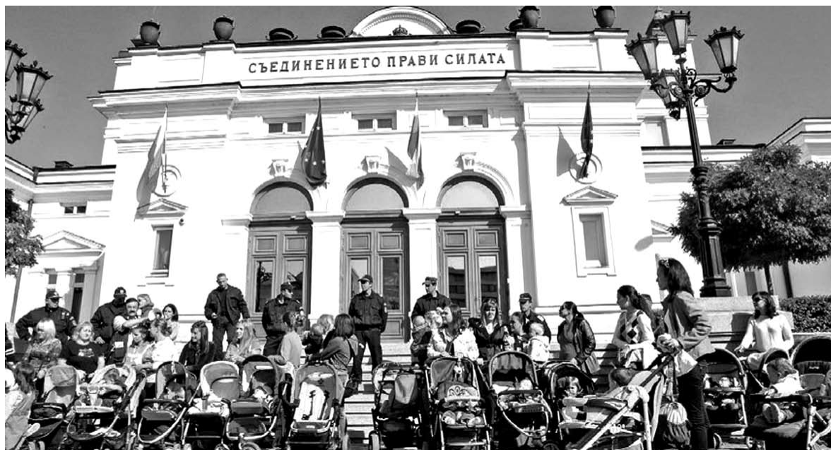
Майки на протест пред Народното събрание

Това е опасен прецедент. Главното мюфтийство е българска религиозна институция още от 1908 г. и трябва да се грижи за администриране на духовните потребности на нашите братя българи-мюсюлмани. Не бива да позволяваме да се превърща в политическо оръжие на неосманистката експанзия на Ердоган и Давутоглу по