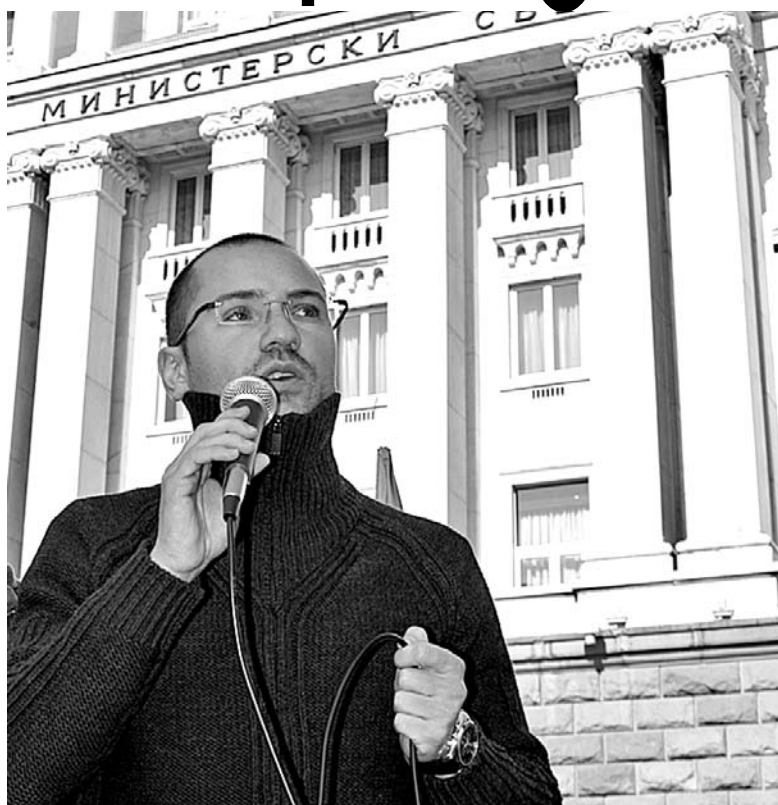
Ангел Джамбазки по време на антимонополен протест в София

маилов, Реформаторският блок е в коалиция с неосоманиста Ердоган. Целта на тази коалиция е ясна – Ердоган организира и направлява гласовете на изселниците в Турция за избори в България – страшно опасна практика.