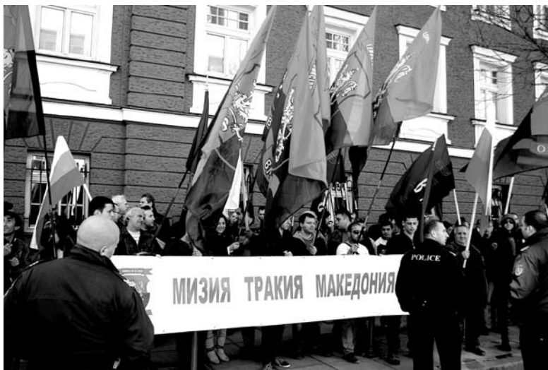
Българи от Македония, Западните покрайнини и представители на ВМРО скандираха „Оставка“ пред сградата на Министерството на правосъдието

Статистиката показва, че през миналата година Румъния е издала повече от 300 хиляди документа за гражданство на молдовци. В Унгария за периода 2011 - 2013 г. са одобрени над 344 хиляди документа, а Германия от 1952 до 2005 г. е издала над 5 млн. нови германски паспорти.