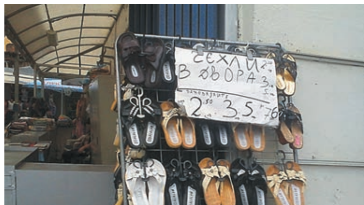
Печално известният Женски пазар в София