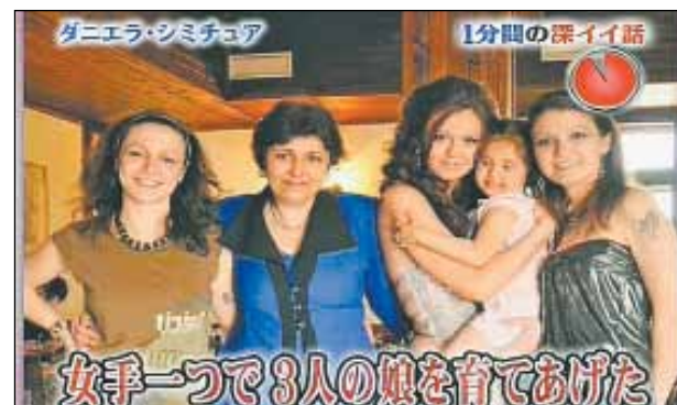
Даниела и нейното семейство в клип, излъчен от японска телевизия.

Майка е на 3 дъщери. Има внучка, която преди дни влезе в първи клас.