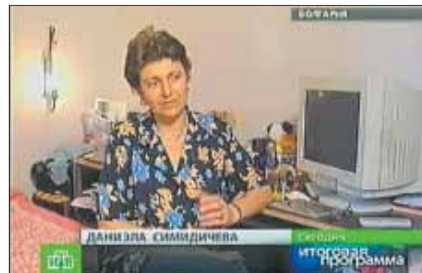
Руската телевизия НТВ я представя като жената с най-висок коефициент на интелигентност.