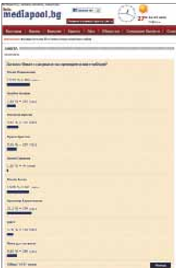
Анкета на „Медиа пуул“